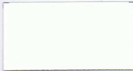
010 weiß-matt -RAL -HKS