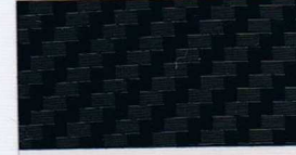
070 schwarz -RAL -HKS