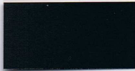
070 schwarz matt -RAL -HKS