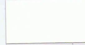
010 weiß -RAL -HKS