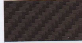
080 braun -RAL -HKS