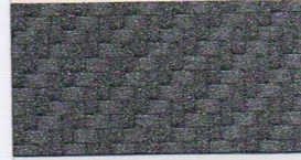
093 anthrazit -RAL -HKS